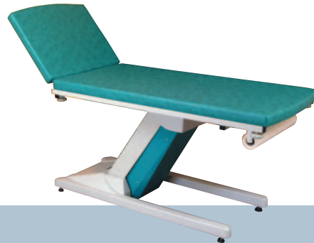
AMANDE / Turquoise