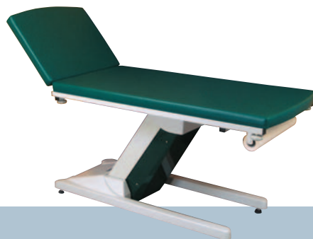
MALACHITE / Fougère

Nous nous réservons le droit de modifier sans avertissement les caractéristiques ci-dessus / The company reserves the right to modify without warning the above-mentioned features.