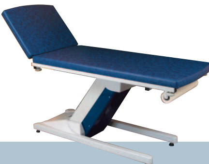
ORAGE / Marine