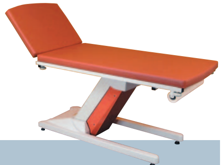
TERRA COTTA / Clémentine