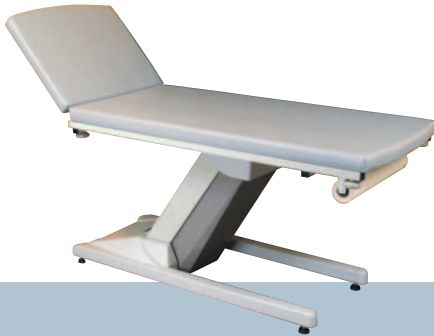
GALET / Platine