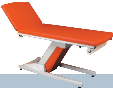
POTIRON / Clémentine