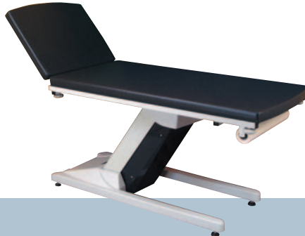
ANTHRACITE / Ardoise