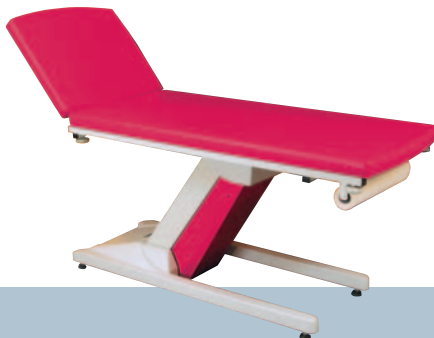
FUSCHIA / Camélia