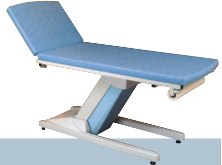
ÉGÉE / Ciel