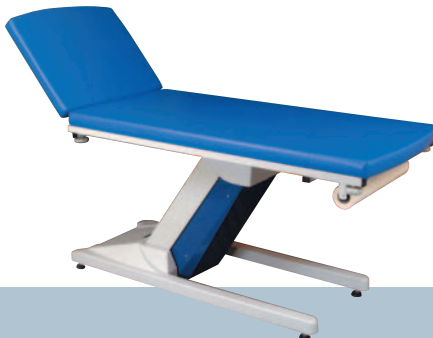
COBALT / Azur